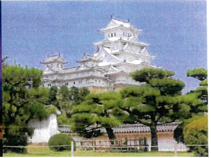
世界文化遺産・国宝 姫路城 (市提供写真)