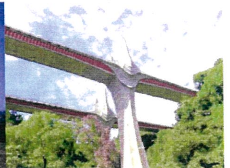
新名神高速道路 近江大鳥橋