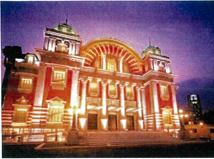
国の重要文化財 大阪市中央公会堂