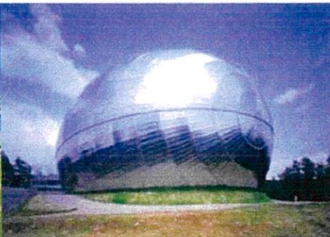
福井県立恐竜博物館