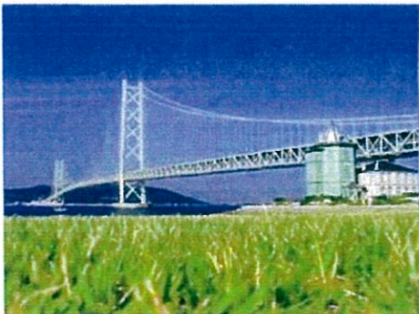
本四連絡橋 明石海峡大橋