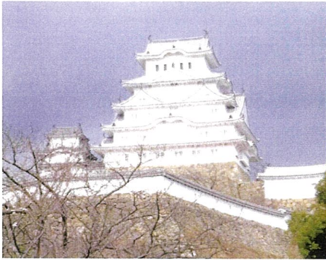
世界文化遺産・国宝 姫路城