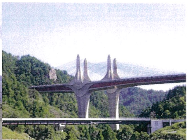
新名神高速道路 近江大鳥橋