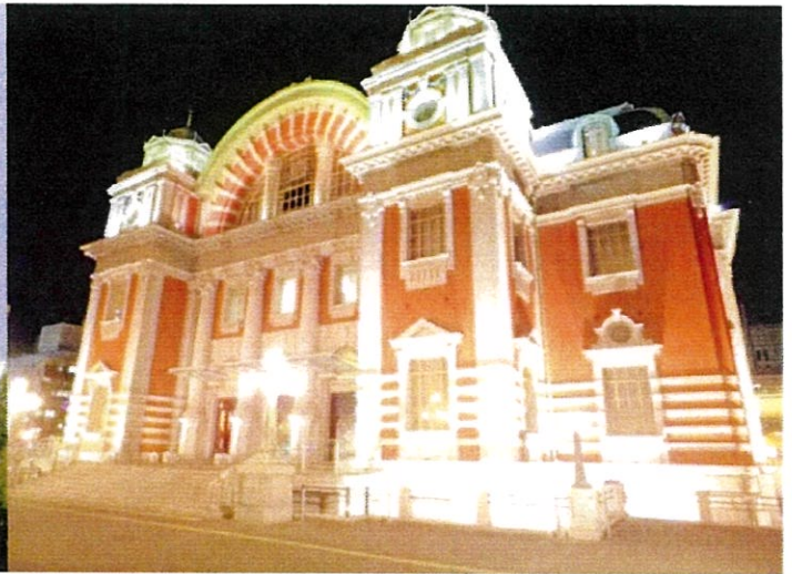
国の重用文化財 大阪市中央公会堂