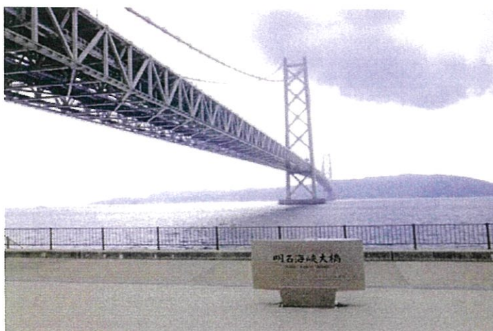
本四連絡橋 明石海峡大橋

社会や地域に役立つ、カッコええことしたい。 ものづくり大好き人間、建設業に集まれ！ これからは、複合工がワンダフル、いろんな職種が体験できる。